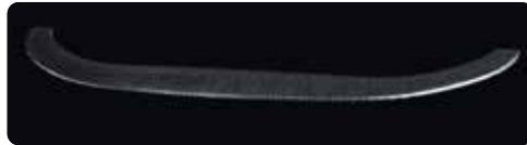
Lutecia 用 カーボンリップスポイラー AS-Lute-fcls 希望小売価格 ¥110,000(税込) 参考作業工数 1.5H 取付工賃別途