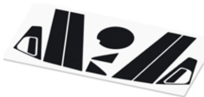
Lutecia 用 ピラーステッカー AS-Lute-PL01+FL01 希望小売価格 ¥22,000(税込) 参考作業工数 0.6H 取付工賃別途