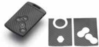
Lutecia 用 カーボン調保護シート AS-cps カーボン柄ステッカーで、スポーティ感アップ カードキーが傷付いてしまうことを防ぎます。 希望小売価格 ¥1,320(税込)